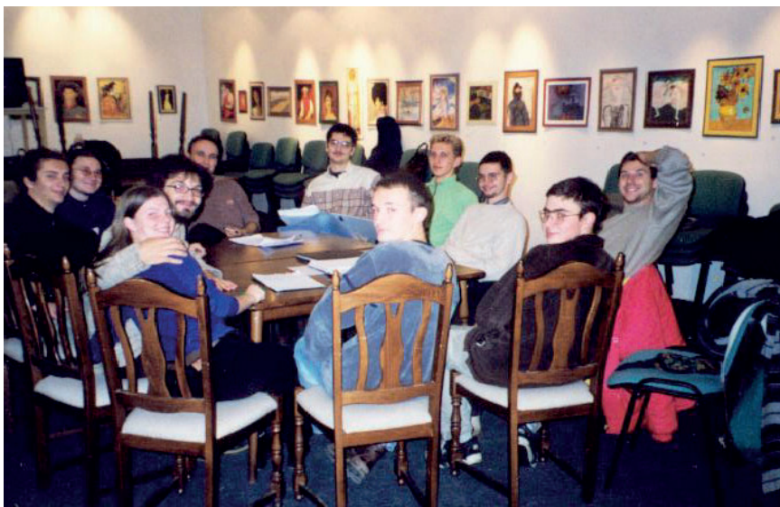
A Kikelet első gyűléseinek egyike a „Vaskapuban”

A kilencvenes évek vége felé ugyan működött Kassán ifjúsági klub, viszont ekkorra már inaktívabb időszakát élte. Ezen próbált változtatni az Új Nemzedék Táncegyüttes legfiatalabb generációja a Diákhálózattal karöltve. A Fórum Társadalomtudományi Intézet kassai irodájának támogatásával, amely a fiatalok rendelkezésére bocsátotta a közismert néven Vaskapuként emlegetett kassai Magyar Közösségi Házat. Így alakulhatott meg 1999 őszén a Kikelet, amely egészen napjainkig a kassai magyar fiatalok kulturális és érdekvédelmi szervezeteként funkcionál. Azzal a céllal jött létre, hogy a Kassán tanuló magyar egyetemistáknak és a további magyar diákoknak, valamint az itt dolgozó fiataloknak fórumot biztosítson arra, hogy találkozzanak, megismerkedjenek és barátságokat köthessenek.