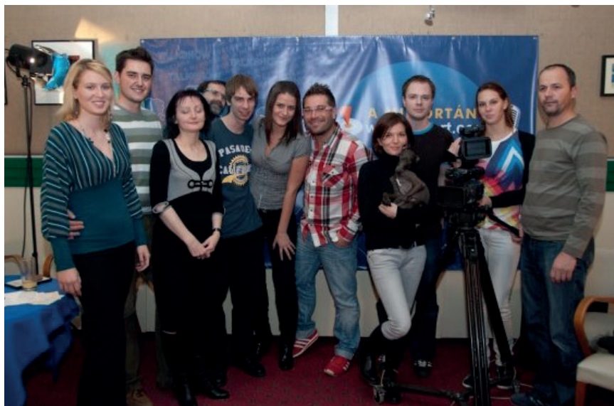
A Mi portánk talkshow forgatásán