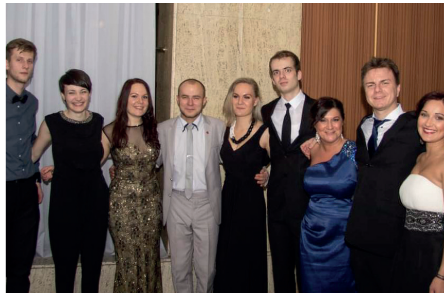
Magyar bál 2016