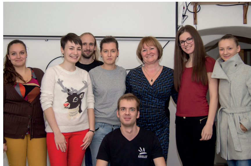
Előadást követő közös kép a Pincklubban