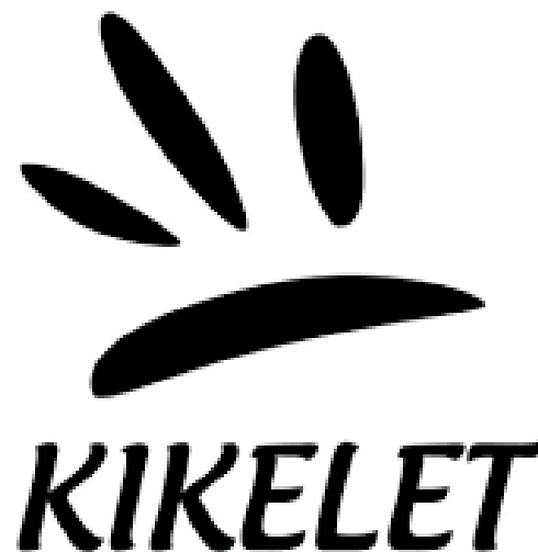
A Kikelet logója