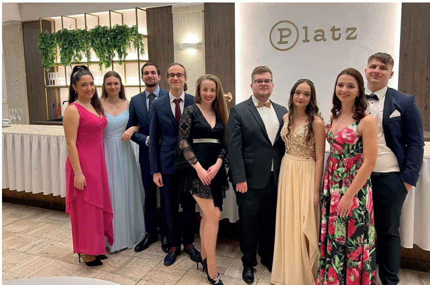
Kassai magyar bál 2023