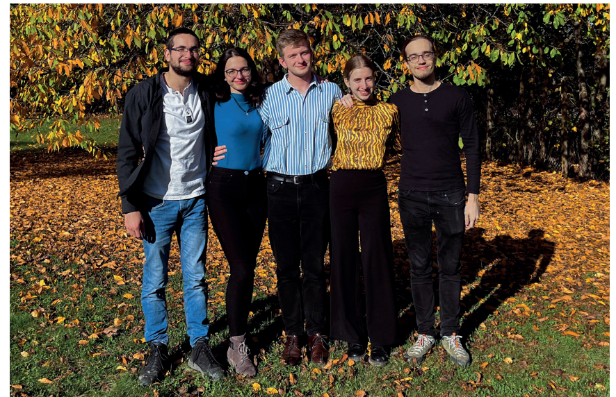
Kikeletesek a XL. Hallgatói Parlamenten