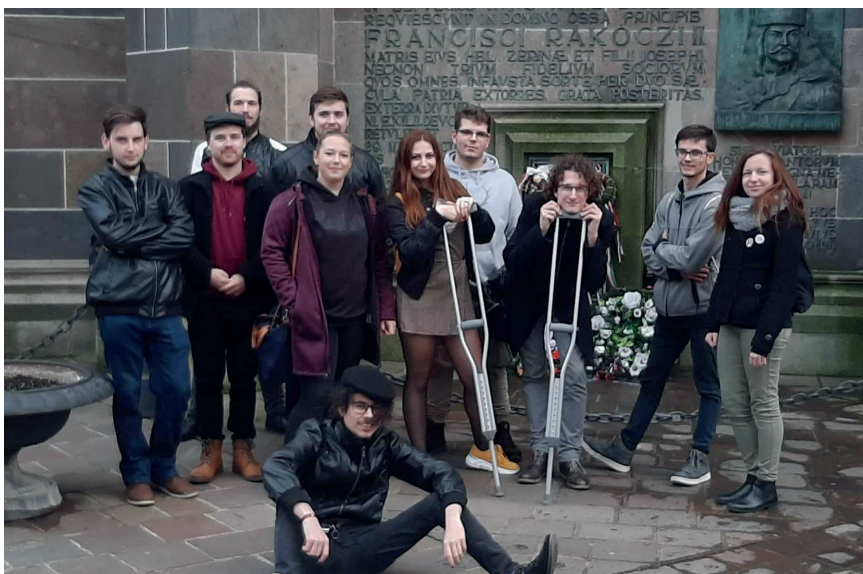
Kikeletesek és diákhálózatosok a Szent Erzsébet székesegyháznál