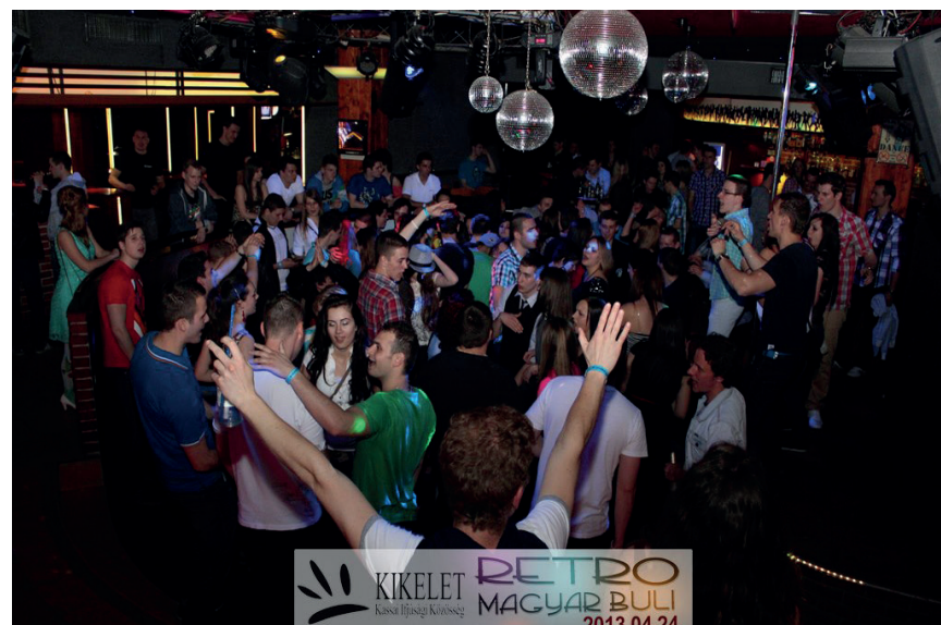
Retró magyarbuli 2013