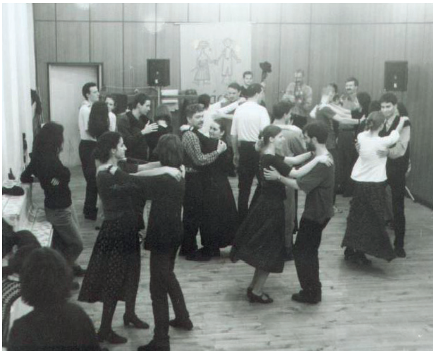
A Kikelet első táncháza 1999-ben