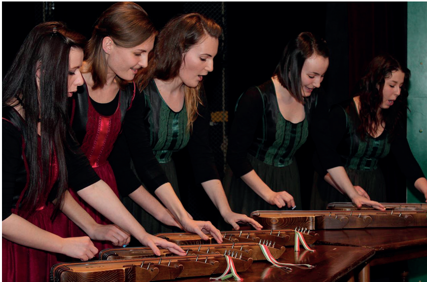
Költészet napja 2014