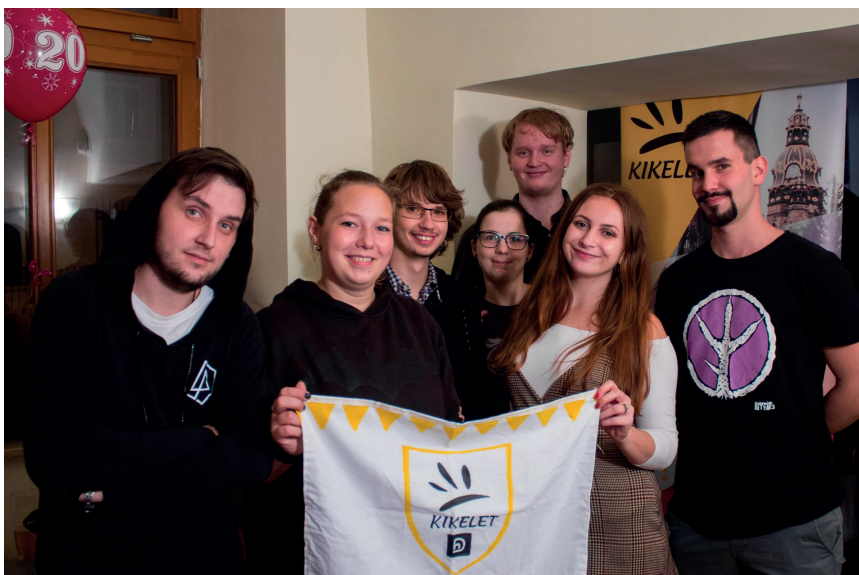
A Kikelet 20 szervezői csapata