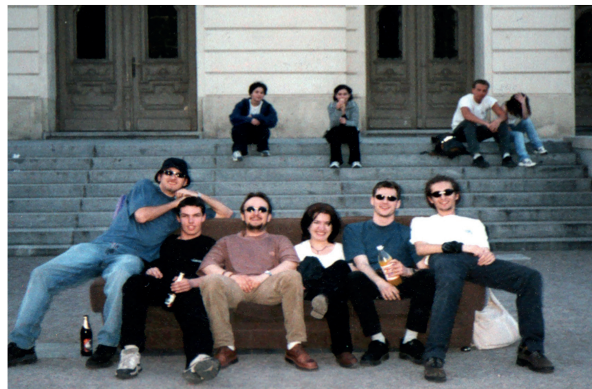
Kanapén a Kassai Nemzeti Színház előtt