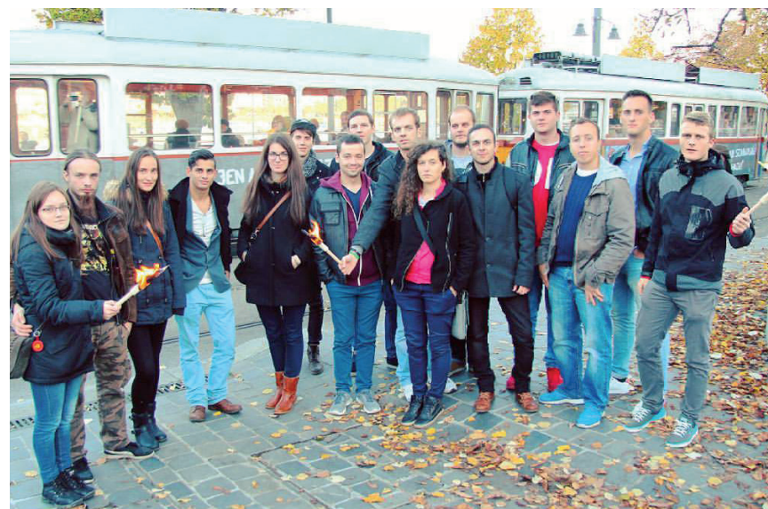
Kikeletesek Budapesten, a Gloria Victis fáklyás felvonulására készülve