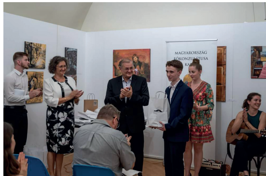
A Versforraló irodalmi pályázat díjkiosztója