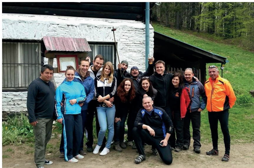
Túra a Lajoškára