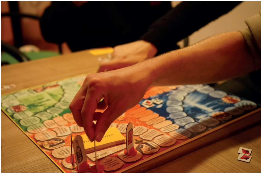
Játékest a Kikeletben